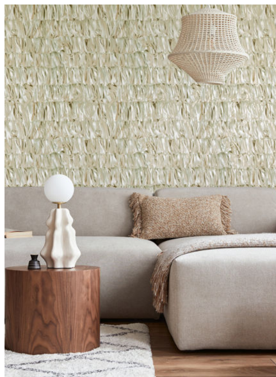
Für die Dessins von Kollektion „Salt“ wurden Blätter, Blüten und Gräser gesammelt und neu arrangiert. So erinnert „Calma“ an bewegtes Blattwerk. Veredelt mit dezentem Glanz entsteht auf der Oberfläche ein attraktives Lichtspiel.