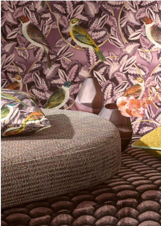
Eine fantasievolle Welt voll schillernder Vögel auf dichtem Blattwerk: Tapete „New Paradise“ greift das Muster von Dekostoff „Hidden Paradise“ auf.