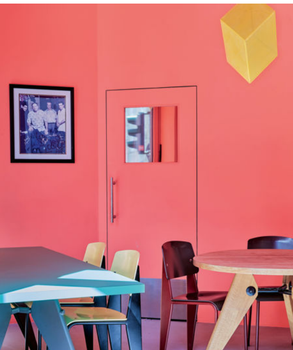
Laut Forschung wird die Temperatur in Räumen mit rotem Anstrich, wie hier mit „No 112 Hippster“, bis zu vier Grad wärmer empfunden.