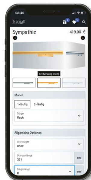
3. Mittels Swipen können alle zur Verfügung stehenden Oberflächen ausgewählt werden. Der aktuelle Preis ist jederzeit ersichtlich.

Der neue mobile Katalog ist das digitale Abbild aller Interstil-Kataloge und somit ein lückenloses Kompendium über alle Kollektionen. Als Smartphone-Lösung bietet das Tool zu jeder Zeit und an jedem Ort Zugriff auf Zahlen, Daten und Fakten zu jeder Garnitur. Der Konfigurator zeigt nach Eingabe weniger Parameter die aktuellen Preise (Bild 3) und ermöglicht so die schnelle Preisauskunft gegenüber Interessenten.