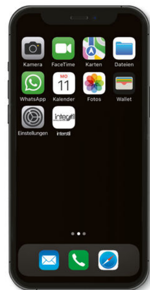
6. Mit wenigen Klicks lässt sich die Web-Applikation auch auf dem Homescreen wie eine normale App darstellen und bedienen.

rationen, um beispielsweise mehrere Anlagen zu einer Kundenkommission zusammenzufassen oder den Online-Bestellprozess auszulösen.