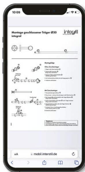
5. Zu jeder Garnitur steht die Montageanleitung online abrufbar bereit.