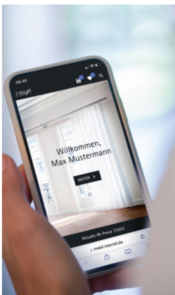
1. Läuft auf jedem Smartphone: Der mobile Interstil-Katalog