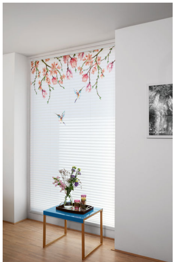
Tiefenwirkung: „Twilight“ von JAB Anstoetz Systems kreiert gleichmäßiges und sanftes Licht – hier Modell „Canvas“.