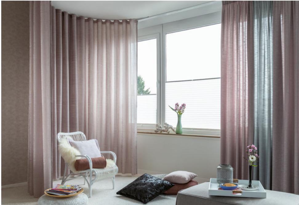
Im Duett: Die Marke „Sunlife“ von Indes Fuggerhaus kombiniert Sonnenschutz-Systeme mit wohlichen Dekorationsstoffen – hier „Evora 7222“ und „Hero 7230“ in Verbindung mit einem weißen Plissee.