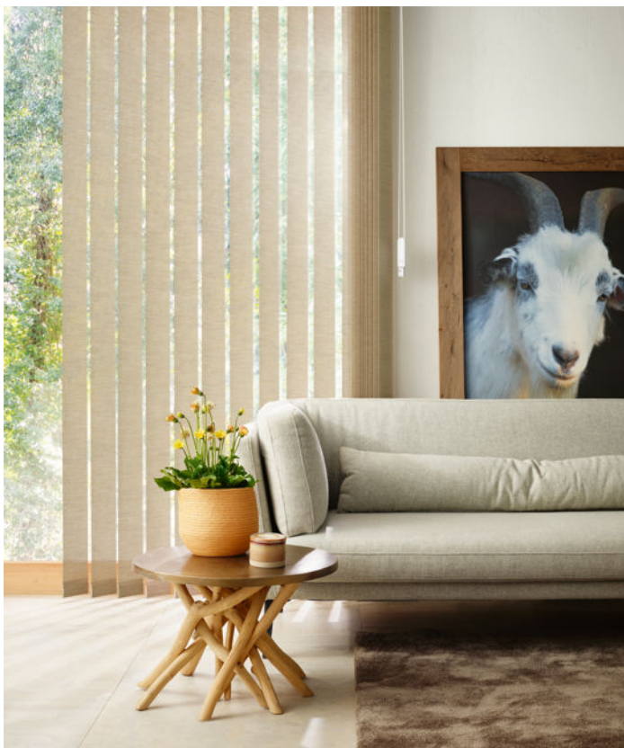
Gut fürs Raumklima: „Pearl“-beschichtete Stoffe glänzen mit ihren Reflexionswerten und ihrem Effekt auf die energetische Bilanz.