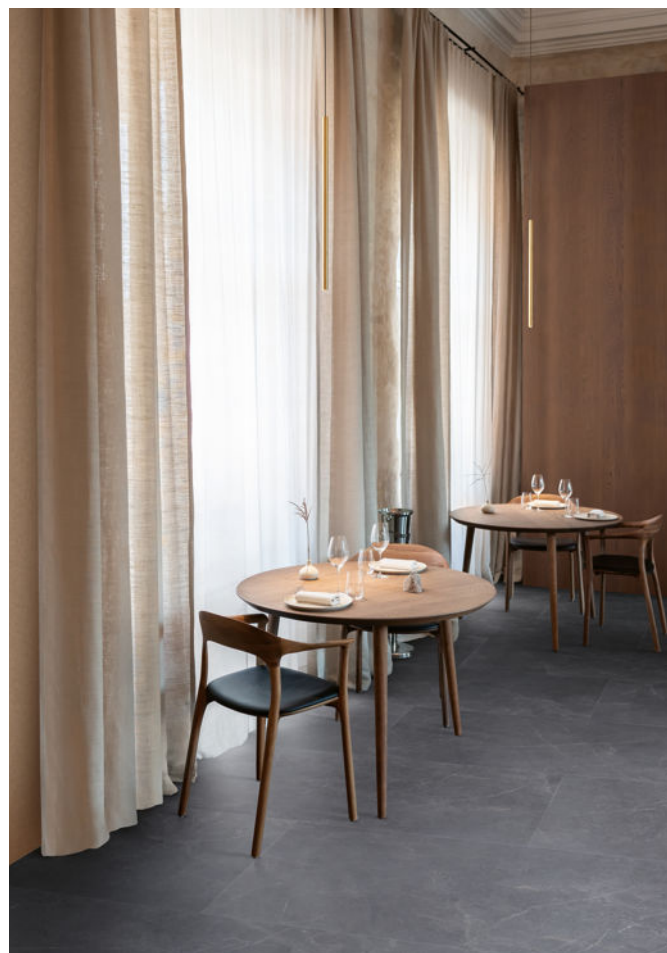
Die außergewöhnlich großen Fliesen „Caldera Marmo“ vermitteln ein Gefühl von Ruhe und Weite.

angeboten. Der Hingucker unter den Neuheiten ist die „Caldera Marmo“-Kollektion: Diese Fliesen im Marmorlook sind im klassischen Format 30 x 60, aber auch extragroß in 60 x 120 Zentimeter erhältlich. Das auffälligste Merkmal der „Parquetvinyl“-Kollektionen ist die integrierte dampfdichte, charakteristisch orange „IXPE“-Unterlage. Zusammen mit dem „Tight-Lock“-Klicksystem ist eine schnelle und einfache Verlegung garantiert. Die Rigid-Boards von Lamett sind zu 100 Prozent wasserresistent, stoßfest und für jeden Raum, sowohl für private als auch gewerbliche Anwendungen, geeignet. „Parquetvinyl“ ist frei von Weichmachern, gibt keine chemischen Stoffe (VOC) ab und kann vollständig recycelt werden.