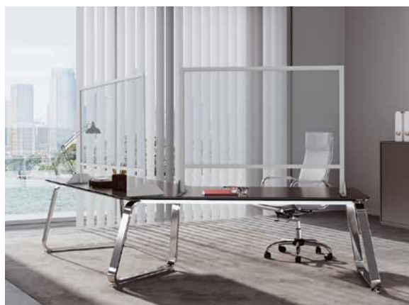
Mit wenigen Handgriffen ist der Hygieneschutz-Aufsteller installiert. Die klare Polycarbonatscheibe mit Aluminiumrahmen präsentiert sich so als eine dezente und ästhetische Lösung.