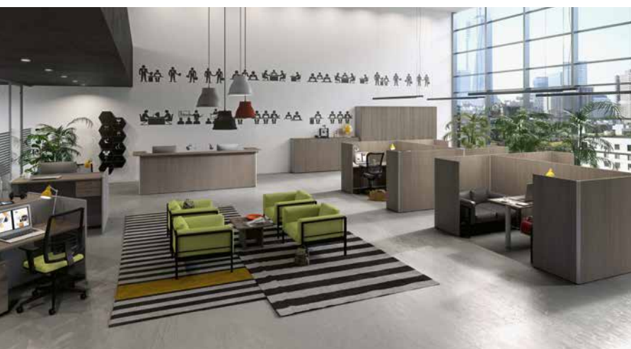
Kleine Besprechungsräume und Büros: Mit Schreibtischen, Containern, Regalen und vor allem Begrenzungswänden stellen sich die Systeme „Kamos Pure“ und „Kamos Plus“ den Aufträgen der Arbeitswelt.