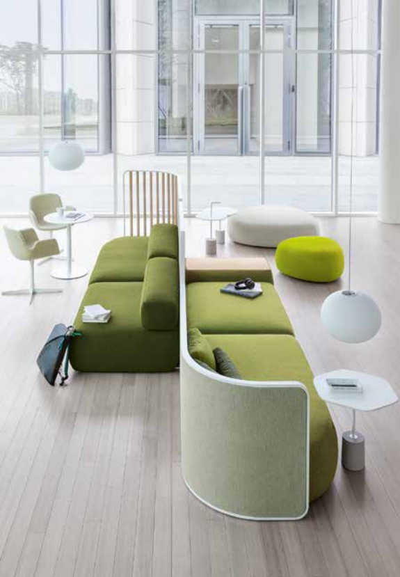
Mit sehr einfacher Befestigung ermöglichen die Module von Sofa-System „Plus“ variable Sitzplätze. Kombiniert mit Trennwand „Screen“ entstehen entspannte Kommunikationsstätten. www.lapalma.it